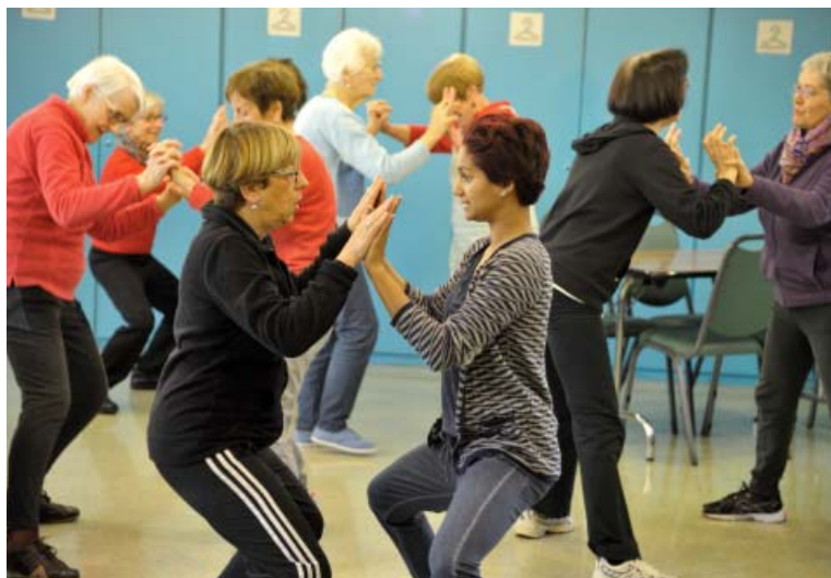
Gym douce au foyer Foch