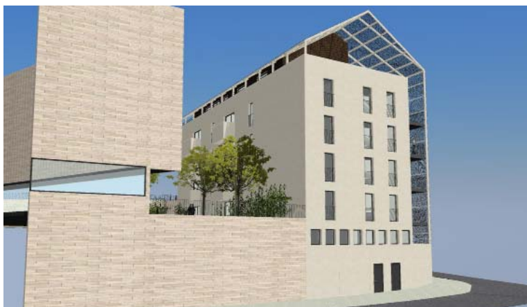
Projet de résidence innovant et solidaire à Combarel